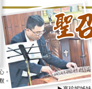
▶高珍妮姊妹 喜樂分享愛。