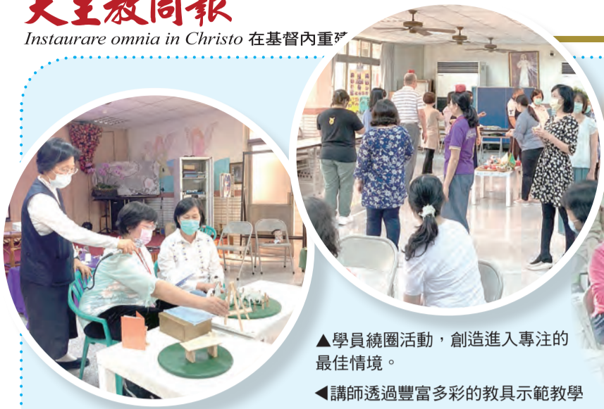
▲學員繞圈活動，創造進入專注的最佳情境。