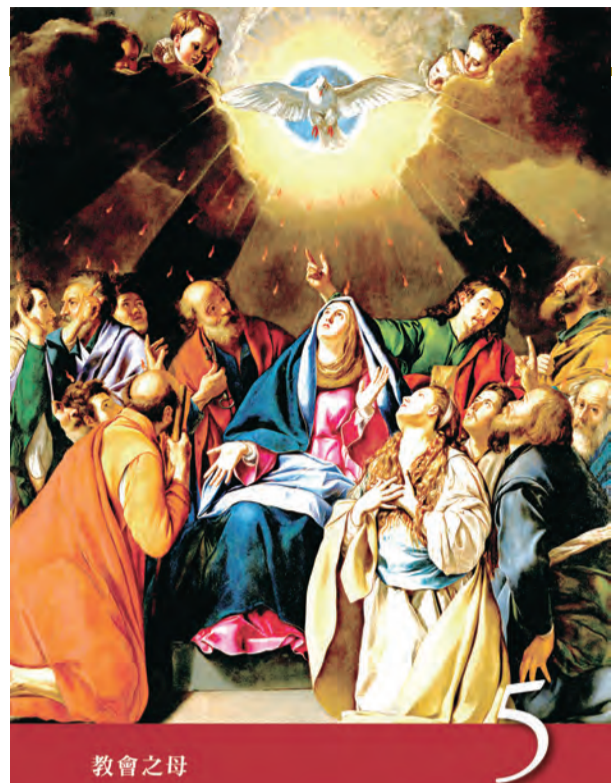
▲〈聖母德敘禱文〉之5：教會之母