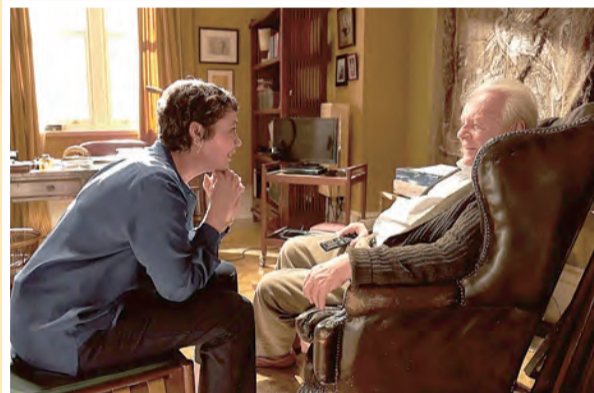
▲《父親》細膩刻劃親情與失智症的無奈，揪心感人。

愉快的過節形成張力十足的對比，這也是親情間試著要溝通與體諒的大難題之一，值得深思自省，我們會是那毫不留情、漠然詢問「你到底還要活多久來惹人厭」的絕情者嗎？我們會有意無意刺傷猶有意識的老人家而不自覺嗎？