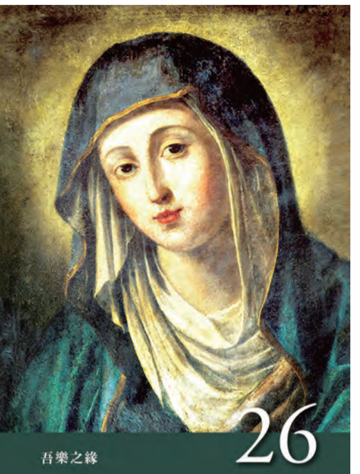
▲〈聖母德敘禱文〉之26：吾樂之緣