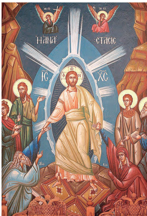
▲東方禮以〈基督下降陰府〉聖像畫慶祝復活節。

當一個人虔誠敬愛天主，便能沉醉於這奧妙且充滿光明的慶典。滿懷感恩服侍上主的僕人，喜悅地與上主同樂吧！有誰克苦地守齋，如今得以獲享該有的恩惠。誰一開始便辛勤工作，如今得以領受理當的報酬。有誰在第三時辰到來，則在感恩中一同歡慶盛宴。誰在第六時辰到來，不必感到不安，絕不會有任何懲罰。誰若稍微慢了些，直到第九時辰才到來，則無須猶豫，快來加入吧！至於那些在第十一時辰才姍姍來遲的人則無須擔憂：因為上主仁慈寬厚，無論先來或後到，皆一視同仁。最早開始辛勤工作的人，待第十一時辰的人到來時得以休息。上主獎賞先來的人，也對後到的人慈