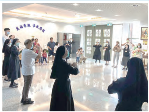
▲共融在主愛的大家庭裡，讓聖召的種子萌芽。

活動的最後是「大聖若瑟節日彌撒」，大家把今天所經驗到的一切獻上感恩，也領受全能天主圓滿的祝福。隆重降福禮後，每位夥伴彼此勉勵，努力成為「地上的鹽，世界的光」，繼續將天主喜樂的愛生活出來，也願意盡力把愛傳出去。