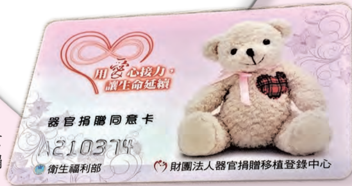
▲建立完善器官捐贈制度，能嘉惠需要者，讓愛延續。

祈求天主讓太魯閣號車禍喪生者的靈魂得到安息，家屬得到安慰及扶助，全台同胞及社會也能從這次不幸中得到一些處理善後，讓往生者遺愛人間的途徑。