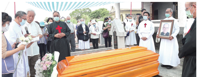
▲靈醫會菲律賓會長主持安葬禮，在禱聲歌聲中入土為安。