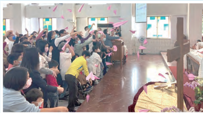
▲把煩憂拋出，讓夢想起飛。