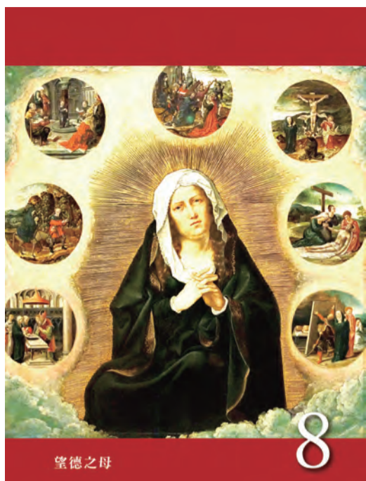
▲〈聖母德敘禱文〉之8：望德之母