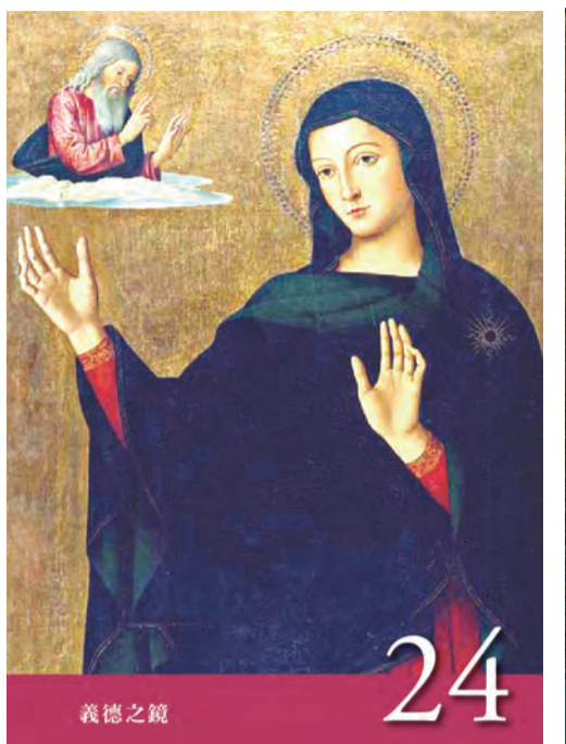
▲〈聖母德敘禱文〉之24：義德之鏡