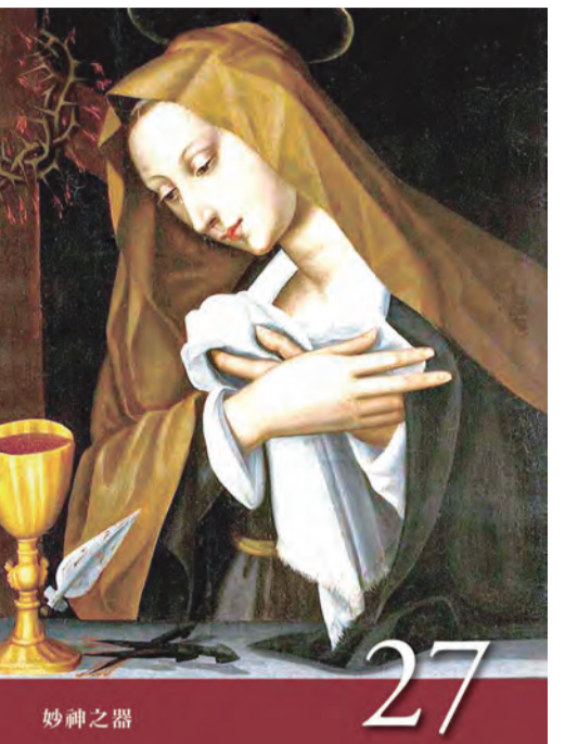
▲〈聖母德敘禱文〉之27：神妙之器

很多的教友家庭都會誦念玫瑰經，在玫瑰經結束之後，除了加念〈又聖母經〉，有時配合節日、瞻禮日，或是特殊敬禮，會再加念其他經文。例如：煉靈月誦念〈煉靈禱文〉，聖若瑟月加念〈聖若瑟禱文〉，遇到特殊瞻禮日，如：諸聖節誦念〈諸聖禱文〉，至於5月的聖母月及10月的玫瑰聖母月，則會誦念〈聖母德敘禱文〉，或是與聖母相關的祈禱文。