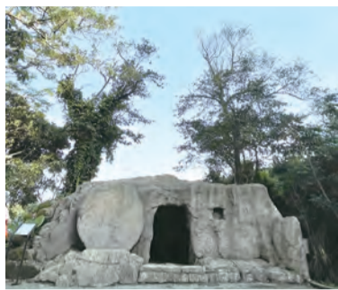
▲聖經文化園區中仿製的空墳，象徵主耶穌祂已戰勝死亡。 ◀汐止朝聖地陽光從穹頂撒下，空間明亮無比。（程若石神父拍攝）