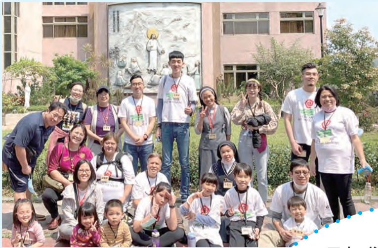
▲一日光鹽營，每個人的身心靈都收穫滿滿。 ▼神父與孩子們的互動，讓孩子從遊戲中學習。