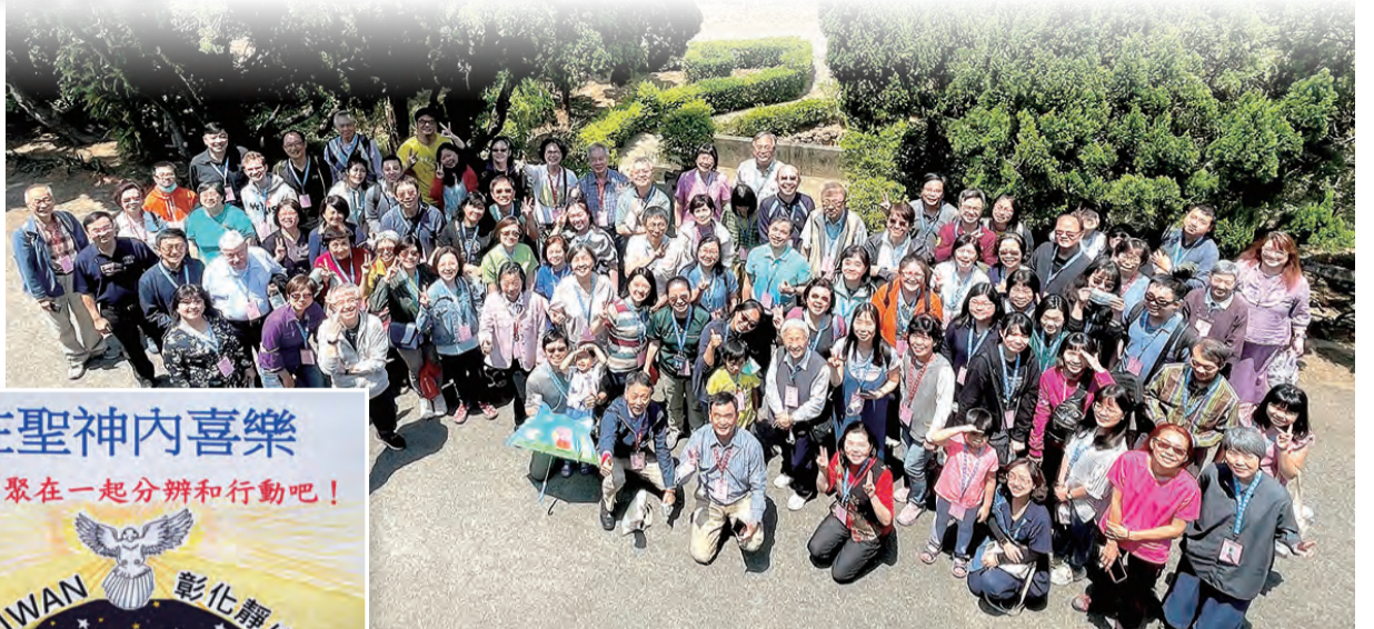
▲生命CLC 團員為此次活動設計製作的海報 ▲歡喜留影，活動圓滿落幕。

和堂區工作相關的是生命基督生活團，數十年來都以堂區服務為使命之一，現在更透過團體分辨後與堂區慕道班銜接，讓新教友有團體的陪伴，也讓「生命」添加生力軍，能提供後續服務；磐石和喜樂基督生活團員看到孩子離開主日學後，雖有堂區青年會及熱心教友陪伴，但團員是否能提供更多的資源和計畫來培育青少年陪伴者？為此提出協助培育青少年陪伴人員的想法，目前仍在團體分辨的初步階段。