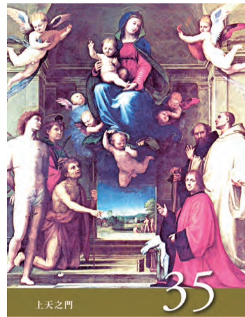
▲〈聖母德敘禱文〉之35：上天之門