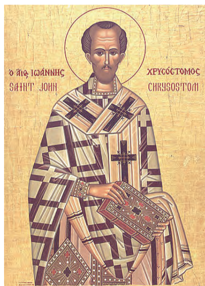
▲金口聖若望聖像畫。

快來為主同歡躍，無論是先來或後到，讓我們同享賞報。無論富貴或貧賤，一同高歌舞蹈。無論明白或糊塗，一同歡慶此日。無論之前守了多少齋，今日都來踴躍歡慶吧！這豐盛的饗宴，足以讓人人都盡情享用。滿桌肥美的小牛，絕不讓人空腹而歸。讓我們同享這信仰的盛宴吧！讓我們所有的人盡享上主美善的榮福吧！再不會有人訴苦，因上主所啟示的天國已經來臨。再不會有人為了自己的過犯而自怨自艾，因基督從墓中帶來了寬恕。再不會有人