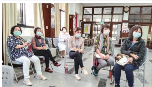
▲接受培訓的主日學老師們專心地聆聽課程