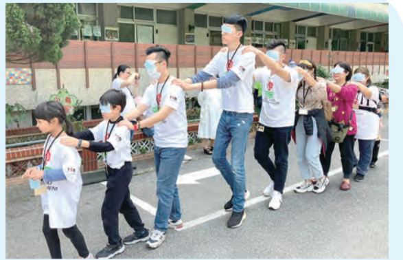
▲體驗遊戲，感受不一樣的情境。 ◀愛德實踐讓我們也收穫滿滿