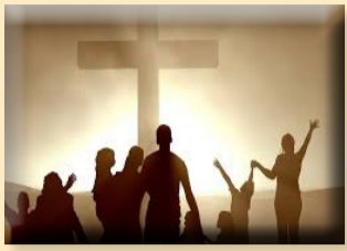
堂區走向社區，準備好了嗎？