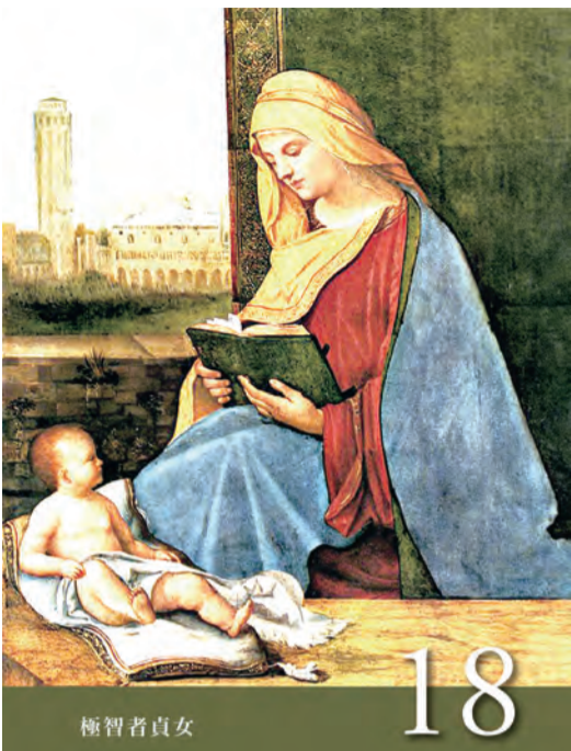
▲〈聖母德敘禱文〉之18：極智者貞女