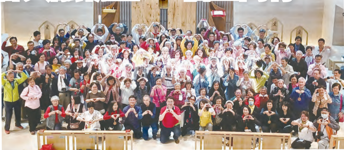
▲南港耶穌聖心堂採光明，禮儀空間美麗溫暖，是當天的朝聖首站。

基督活力運動台北分會經過4個多月籌畫與努力，在指導神師程若石神父帶領下，近160人的復活期共融小朝聖之旅，於4月17日順利成行，在微涼細雨的早晨展開1日旅程。朝聖地點包括：南港耶穌聖心堂、汐止聖方濟朝聖地、天主教達義營地、基督教芥菜種會聖經文化園區，前兩處都是歷經艱難考驗、終於重建完工啟用的聖堂。堂區是信仰之本，每位基督活力員度「虔誠、進修、福傳」的第4天，可說是從堂區服務為起點，進而擴大到鐸區、教區及善會團體，成為耶穌長兄稱手的器皿。