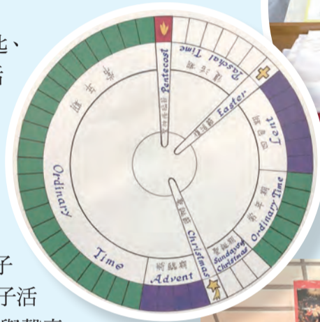
◀禮儀年曆及祈禱卡製作，一目了然。