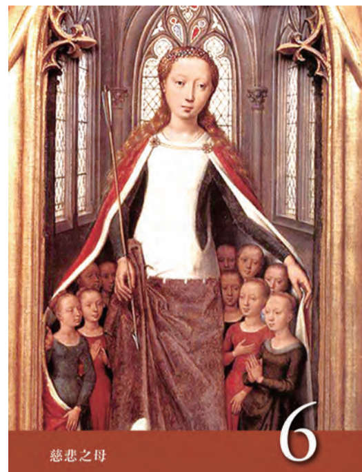
▲〈聖母德敘禱文〉之6：慈悲之母