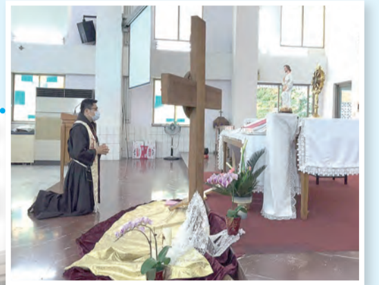
▲沈澱心靈，虔誠朝拜體，與主相遇。 ◀在靜謐中與主交談 ▼可愛的分享，讓人感受親子之愛。

真正內在醫治的第一步，是需要先坦然接受那些在我們生命之中不能選擇的事。當我們一味追求自己認為合理且能接受的解釋，