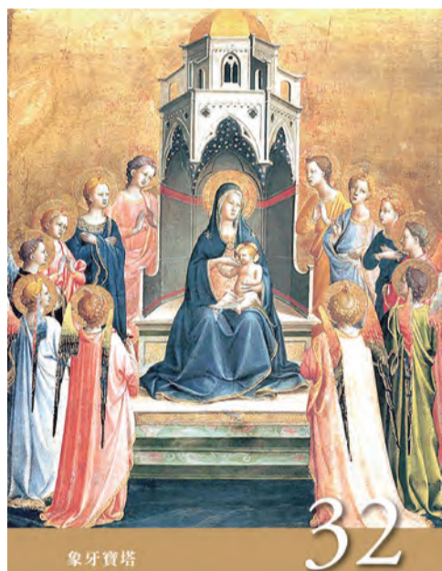
▲〈聖母德敘禱文〉之32：象牙寶塔