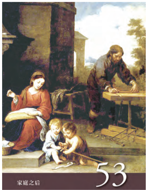
▲〈聖母德敘禱文〉之53：家庭之后