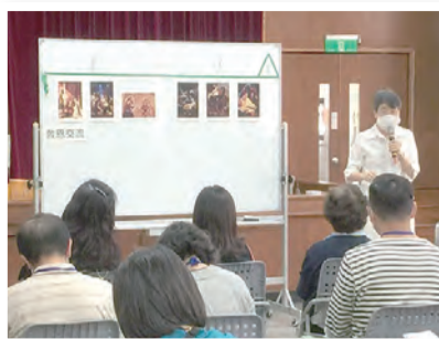
▲今年特別以大聖若瑟為避靜主題