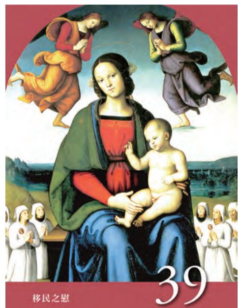
▲〈聖母德敘禱文〉之39：移民之慰