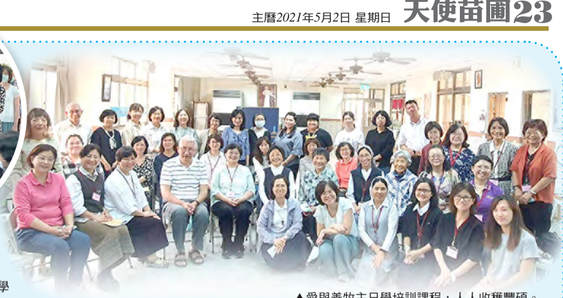
▲愛與善牧主日學培訓課程，人人收穫豐碩。