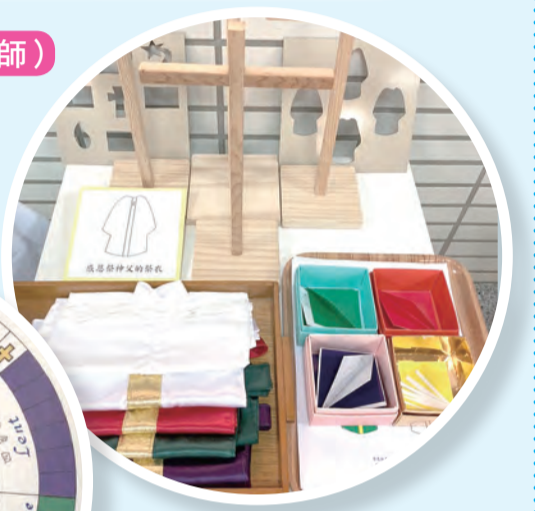
▲縮小版祭衣及禮儀用品，增進孩子學習臨場感。